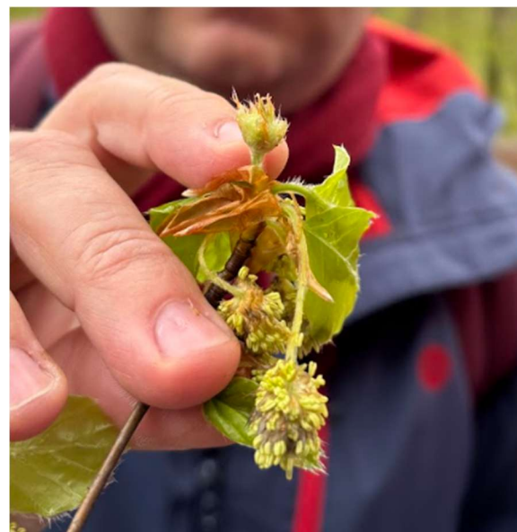
Abb.: männliche und weibliche Blüten der Rotbuche