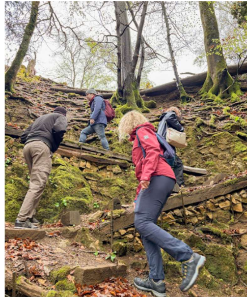
Abb.: Aufstieg zur Ramsflue

Etwas weiter oben konnten wir in aller Ruhe ein Gamsrudel auf einer Weide beobachten.