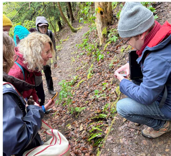
Abb.: Erläuterungen zum Hirschzungenfarn

Trotz Regen, Wind und tiefen Temperaturen waren die ca. 10 Exkursionsteilnehmer und -teilnehmerinnen froh, dass sie sich auf den Weg gemacht und zwei kurzweilige Stunden in der Natur verbracht hatten.