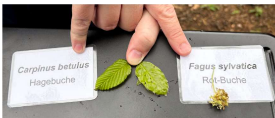
Abb.: Vergleich der Buchenblätter

Auf der Ramsflue bot sich die Gelegenheit, die Rot- und die Hage-, Hain- oder Weissbuche direkt miteinander zu vergleichen. Die lateinischen Namen zeigen, dass die beiden Arten unterschiedlichen Familien angehören; die Hagebuche gehört zur Familie der Birkengewächse.